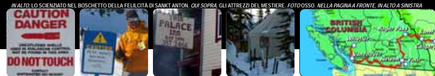
IN ALTO, LO SCIENZIATO NEL BOSCHETTO DELLA FELLCITÀ DI SANKT ANTON. QUI SOPRA, GLI ATTREZZI DEL MESTIERE. NELLA PAGINA A FRONTE. IN ALTO A SINISTRA